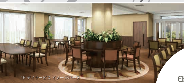
1F デイサービス イメージルーム