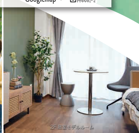
2F 居室モデルルーム